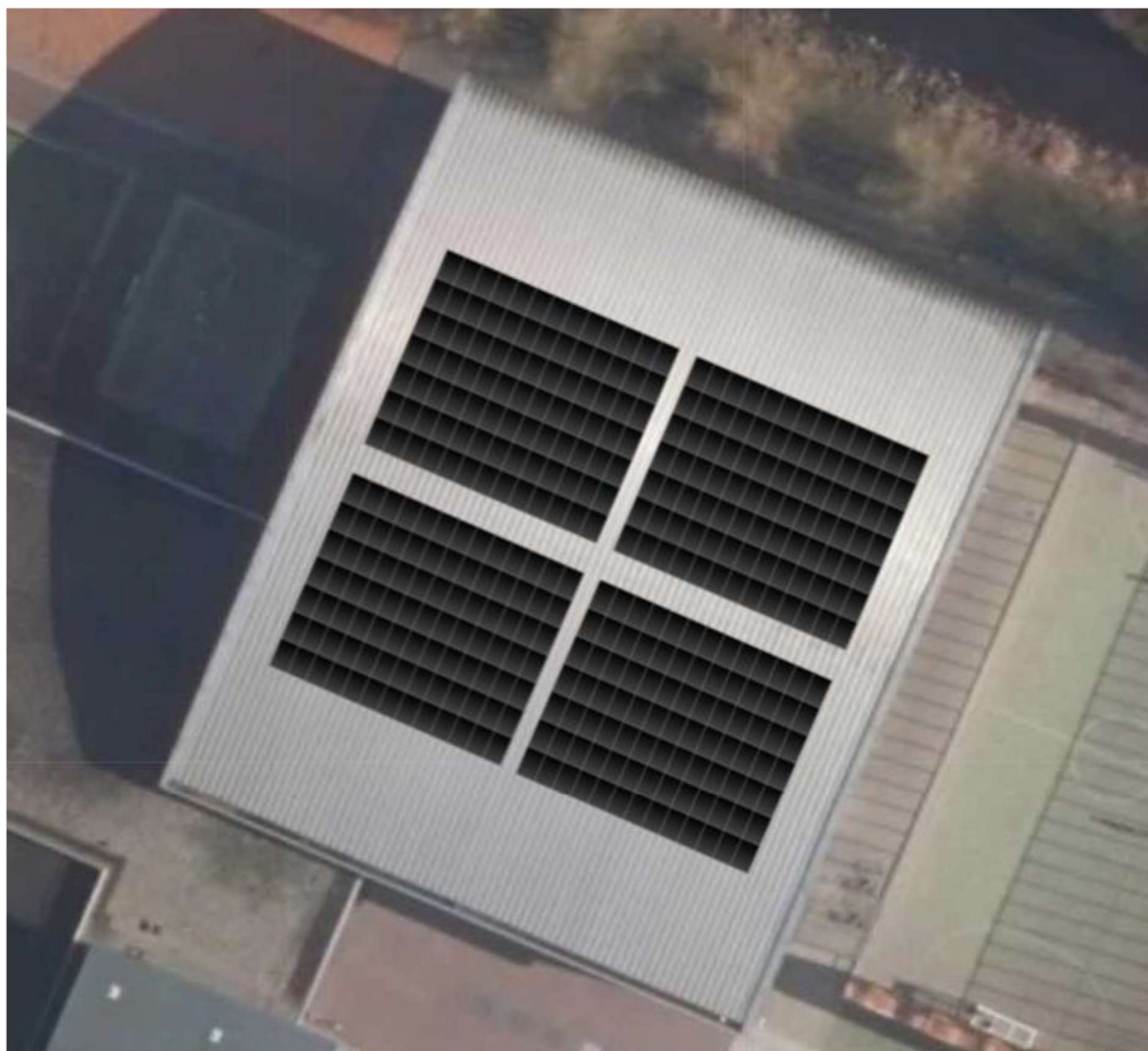
Figuur 6 - Bovenaanzicht sporthal De Kraal