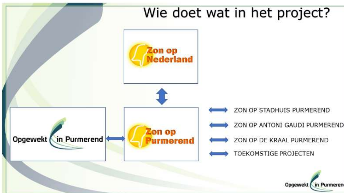
Figuur 1 – Wie doet wat in het project

Wij starten hiertoe het Postcoderoosproject onder de naam Zon op De Kraal (ZODK). Als het project startklaar is, dus als alle deelnemers de factuur betaald hebben, wordt het project formeel overgedragen aan de burgercoöperatie Zon op Purmerend.