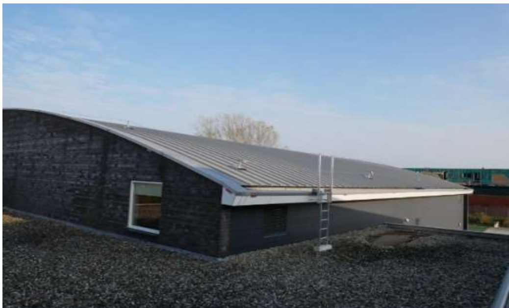
Figuur 3 – Het dak van sporthal De Kraal