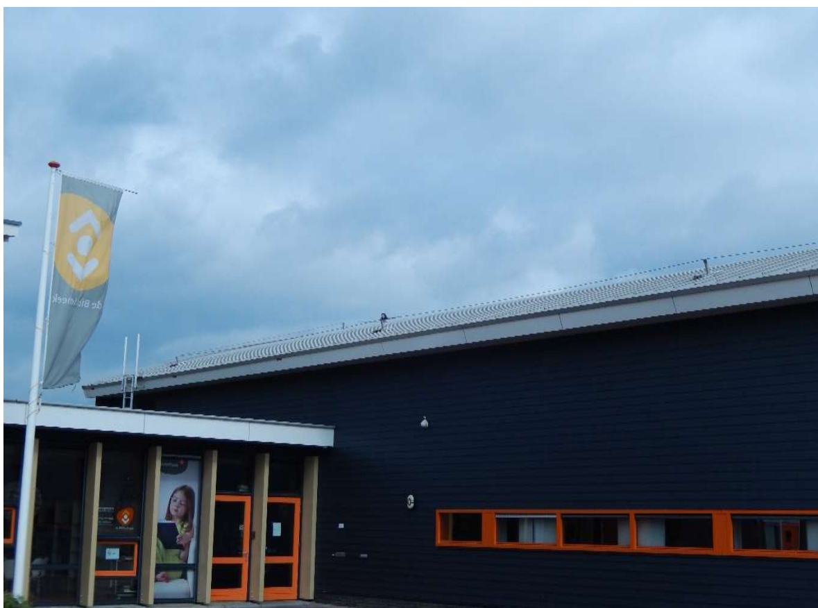
Figuur 5 – Ingang sporthal De Kraal

De gemeente Purmerend stelt het dak van sporthal De Kraal gedurende de looptijd van de overeenkomst beschikbaar. Zon op Purmerend heeft ten behoeve van Zon op De Kraal een constructieberekening laten opstellen waaruit blijkt, dat de draagconstructie van de locatie geschikt is voor de installatie.