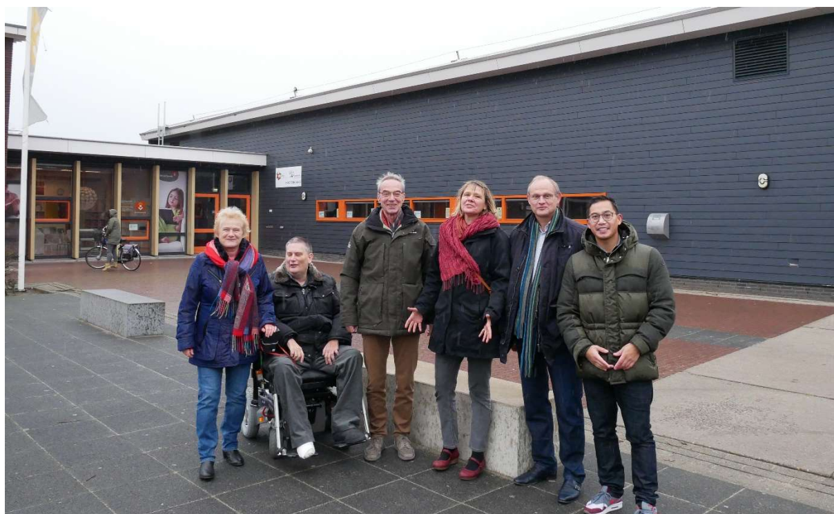
Figuur 2 – Het team van Opgewekt in Purmerend voor sporthal De Kraal

Het project Zon op De Kraal is een initiatief van stichting Opgewekt in Purmerend in samenwerking met Zon op Purmerend Coöperatie U.A. Opgewekt in Purmerend heeft tot doel zoveel mogelijk duurzaamheid te bevorderen in de gemeente Purmerend. Dit doen we o.a. door energie op te wekken in Purmerend. Hierbij wil Opgewekt in Purmerend inwoners van Purmerend - en directe omgeving - betrekken en in staat stellen te participeren in projecten.